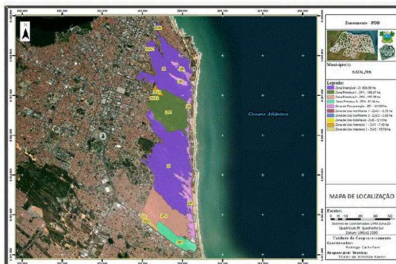
Figura 01. Zoneamento do Parque das Dunas